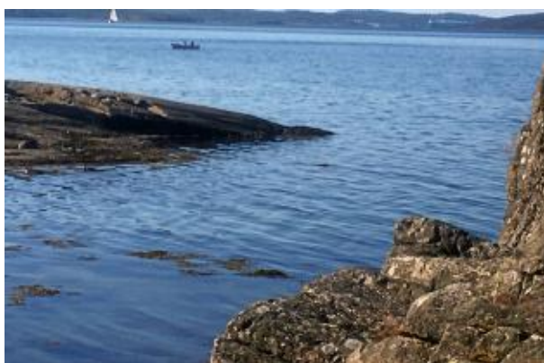
Lövön, Kungälv kommun, juni 2020.